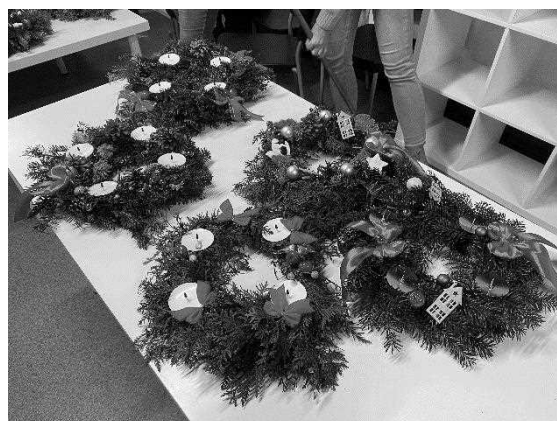
Warsztaty tworzenia wieńców adwentowych na parafii w Szopienicach.