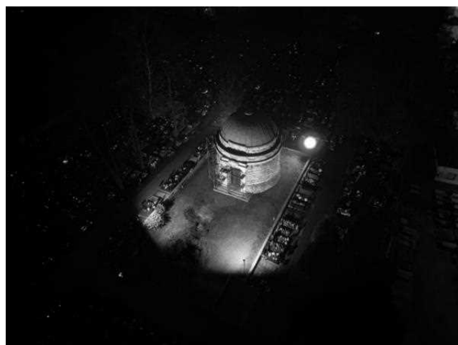
Mauzoleum Dietla zyskało nocną iluminację.